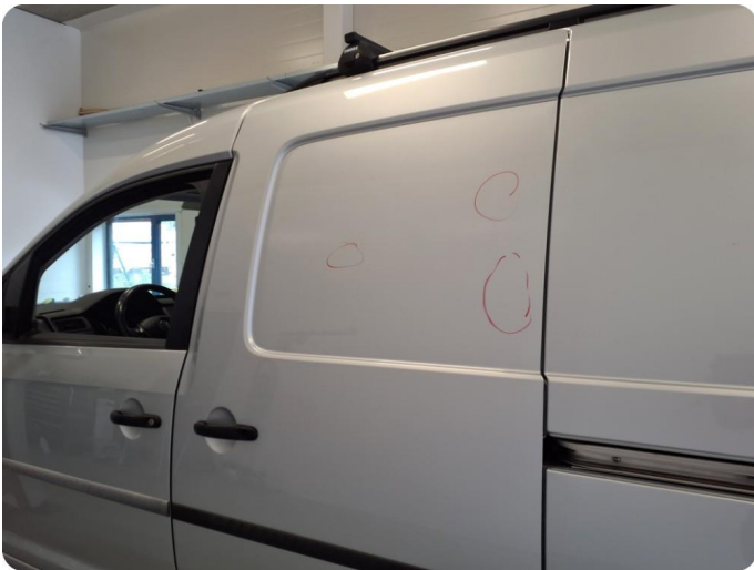
2.1 Flere bulker