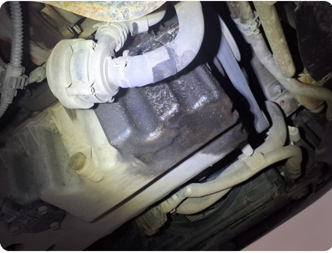
3.1 Svetter Kontrolleres verksted