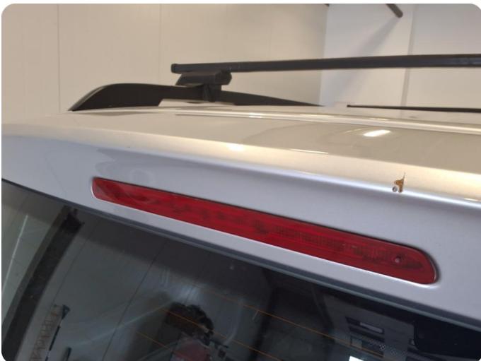
2.2 Bulk med lakkskade