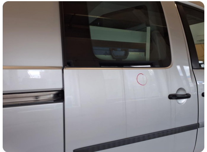
2.1 Flere bulker