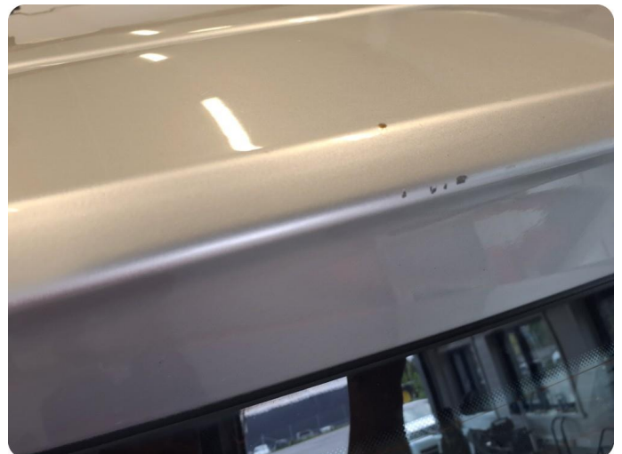
2.2 Bulk med lakkskade