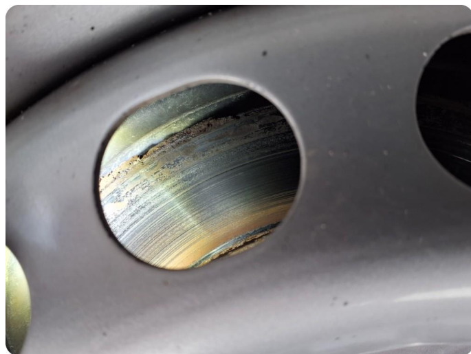
4.1 Slitte/stor slitekant