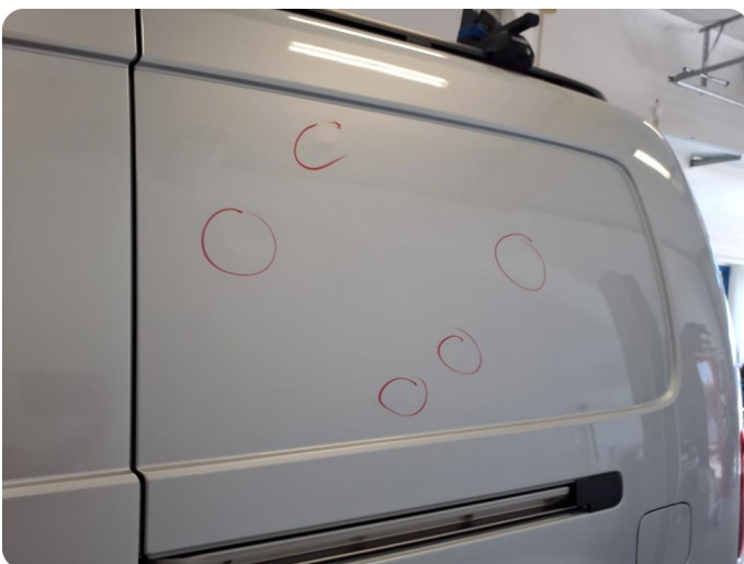
2.3 Flere bulker