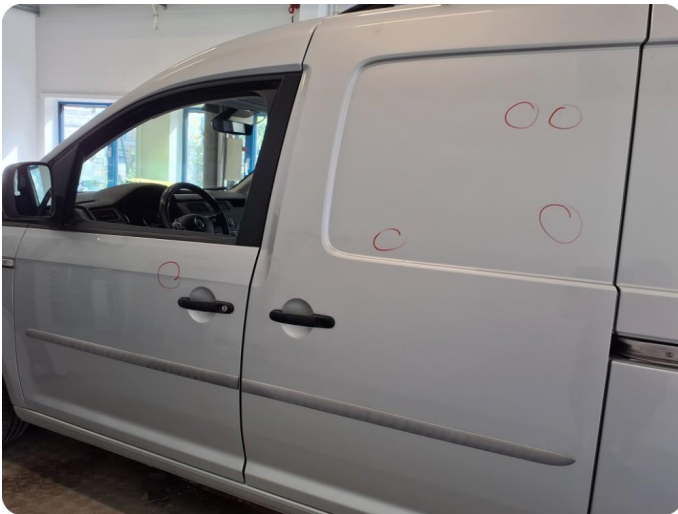
2.1 Flere bulker