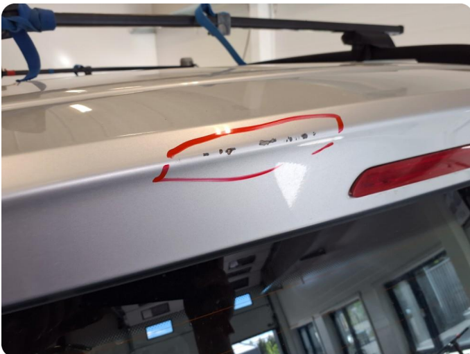
2.2 Bulk med lakkskade