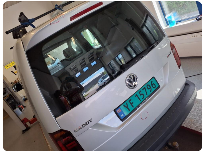
2.2 Bulk med lakkskade