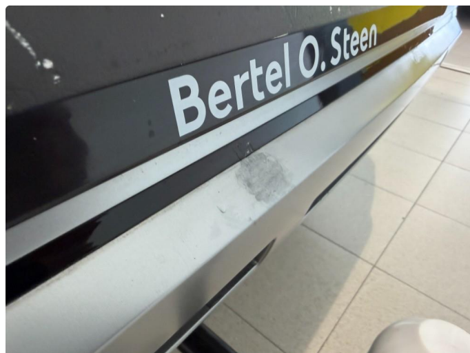
1.2 Liten lakkskade rett over hengerfestet