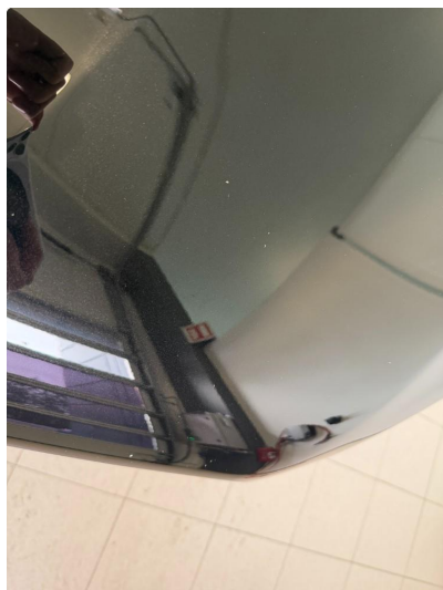
1.1 Noe steinsprut på panser