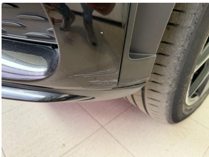
1.3 Riper på frontfanger