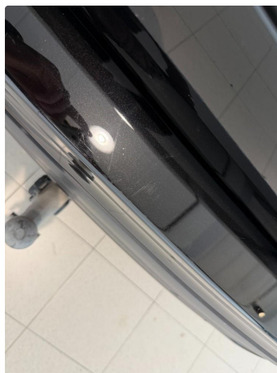
1.4 Normale riper på innlastning bagasjerom