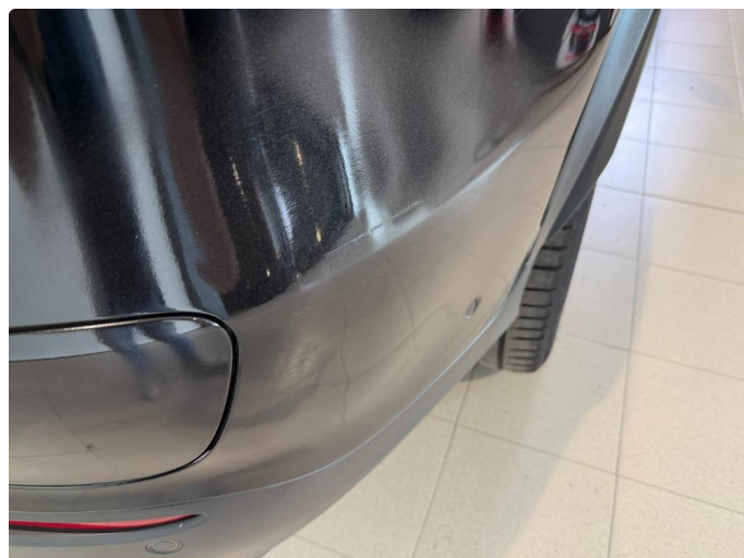
1.2 Riper på baksjerm