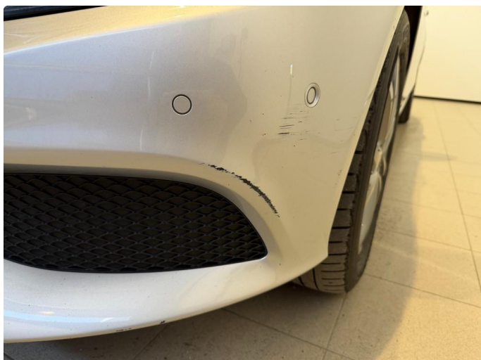
1.1 Ripper på frontfanger