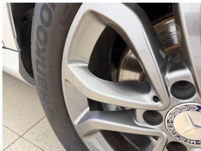
1.3 2 stk kantkjørte sommerfelger