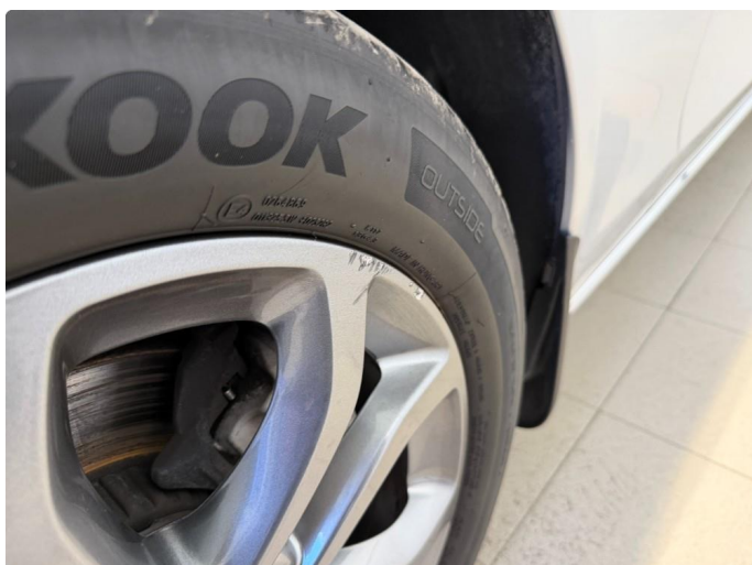
1.3 2 stk kantkjørte sommerfelger