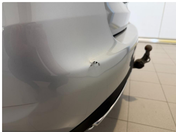
1.2 Bulk med lakkskade på bakfanger