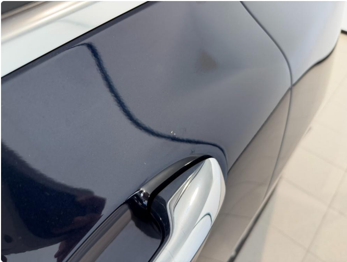
1.1 Ripe ved dørhåndtak