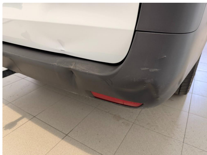
1.4 Bulk på bakfanger