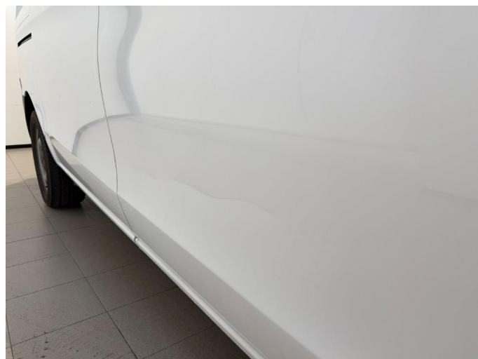
1.2 Ripe på passasjerdør