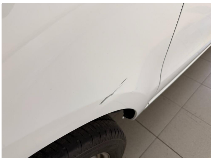
1.3 Ripe på bakskjerm passasjerside