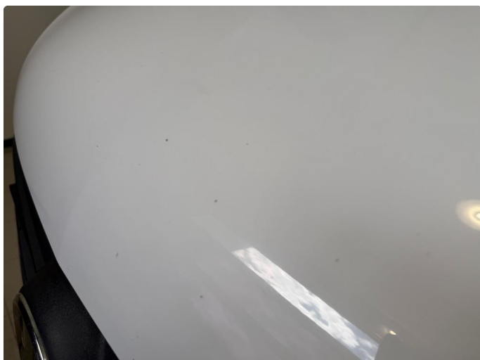
1.1 Steinsprut på panser