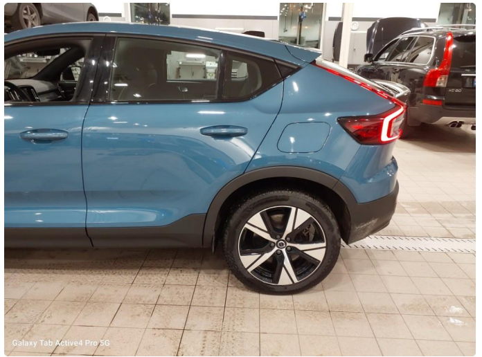
Galaxy Tab Active4 Pro 5G