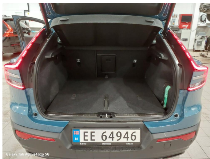
Galaxy Tab Active4 Pro 5G