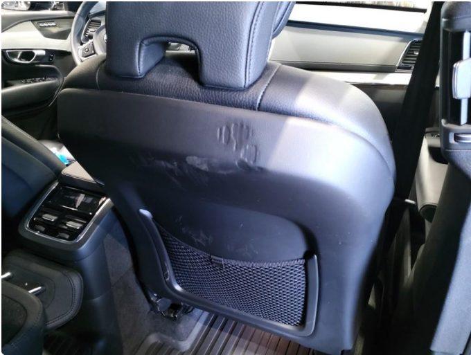
1.1 Skade på seterygg