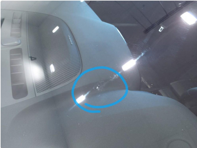
1.1 Steinsprut i synsfelt