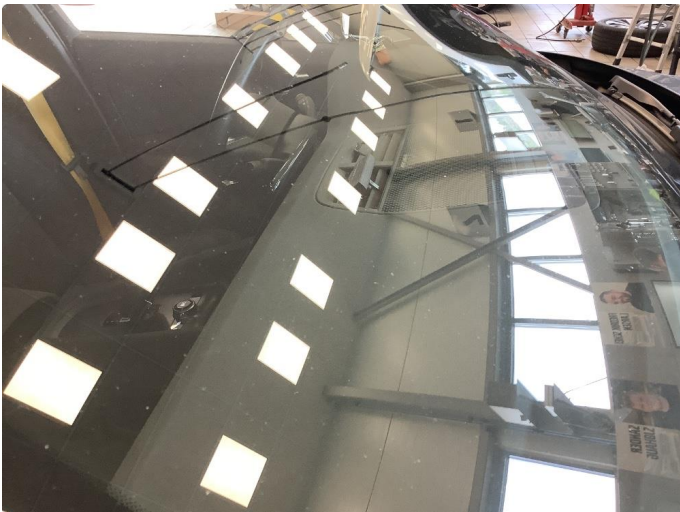
1.1 Noe brukslitasje