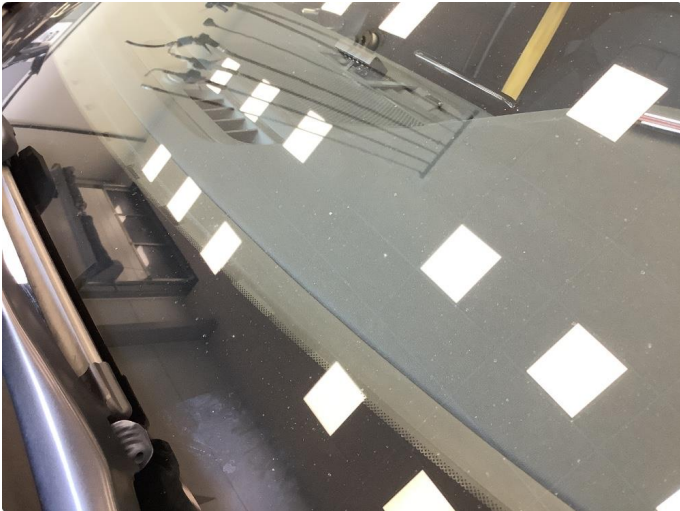
1.1 Noe brukslitasje