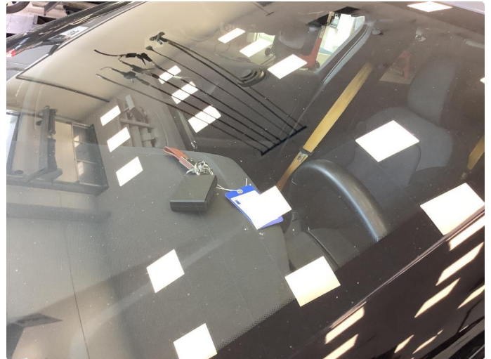
1.1 Noe brukslitasje