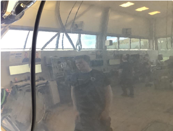
1.1 Liten p-bulk