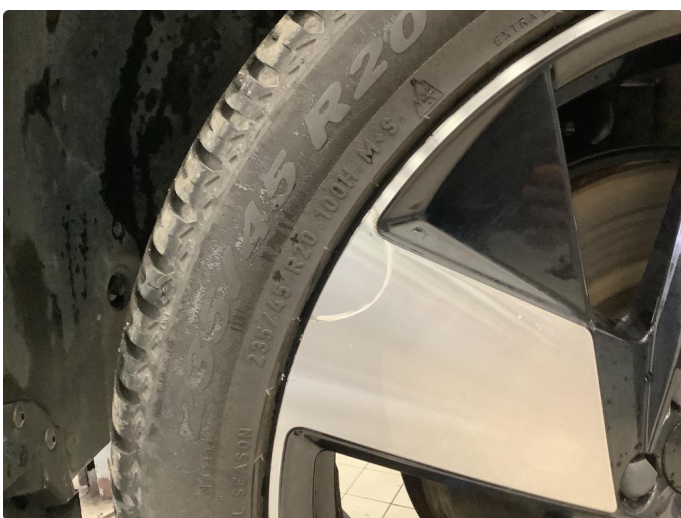
1.4 Små bruksmerker på felg