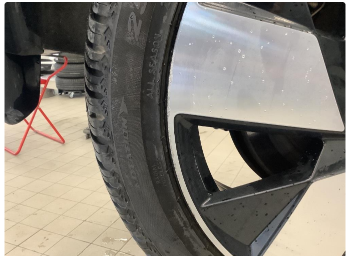
1.4 Små bruksmerker på felg