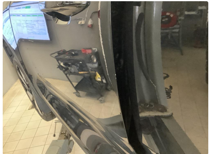
1.2 Liten p-bulk