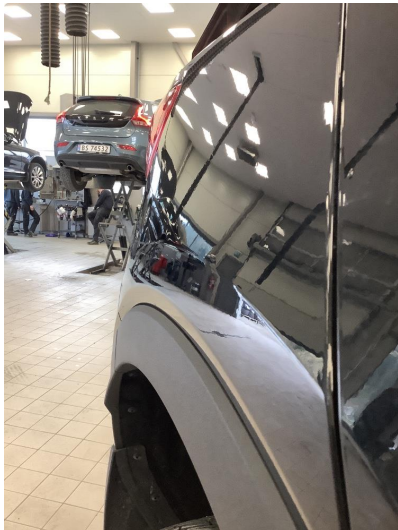
1.3 Liten p-bulk