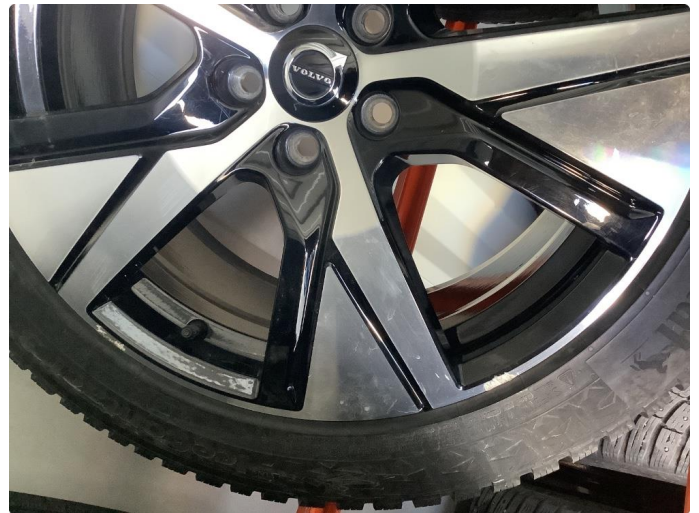
1.1 Små brukesmerker på felg se bilder