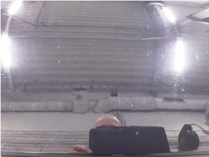
1.1 Stensprut, normal slitasje