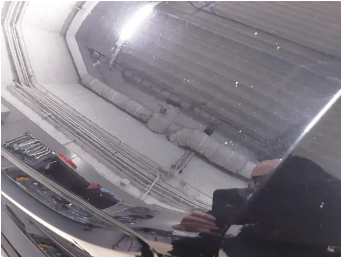
1.1 Stensprut, normal slitasje