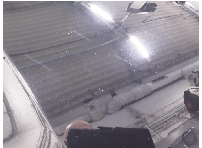
1.1 Stensprut, normal slitasje