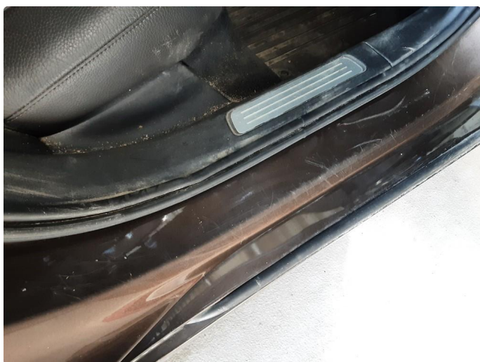
1.4 Noen riper og småbulker, poleres