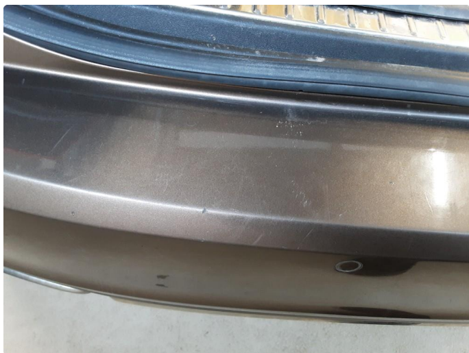
1.5 Riper og slitasje