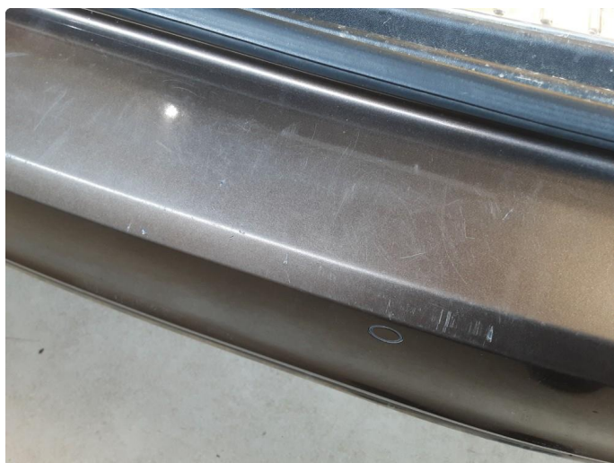
1.5 Riper og slitasje