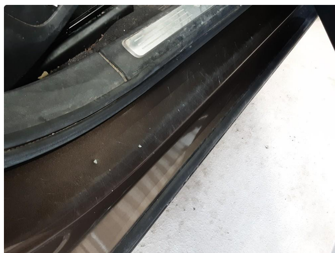
1.4 Noen riper og småbulker, poleres