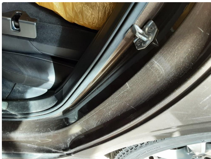
1.4 Noen riper og småbulker, poleres