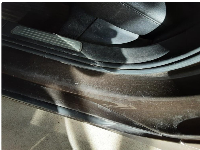
1.4 Noen riper og småbulker, poleres