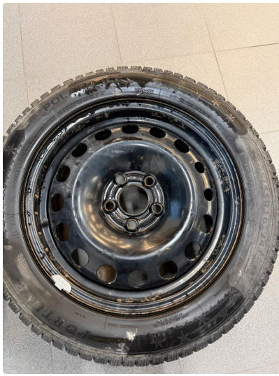
1.7 Slitte hjulkapsler