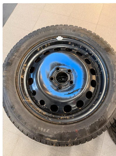
1.6 Slitte hjulkapsler