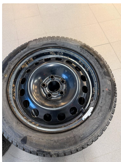
1.5 Slitte hjulkapsler