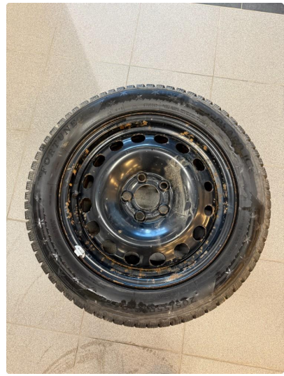
1.8 Slitte hjulkapsler