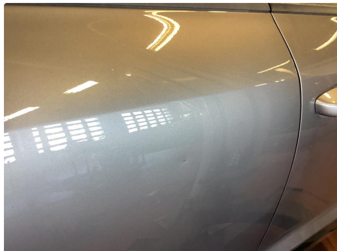
1.2 Liten bulk