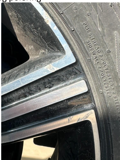
1.2 En sommerfelg litt kantkjørt + en liten dekkskade