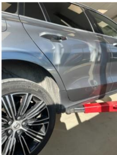
1.1 Noen riper i skjerm høyre bak. Dempes med rubbing og polering