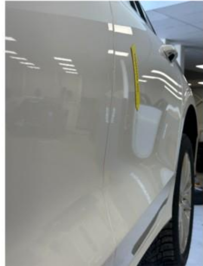
1.2 P. bulk i dør venstre bak