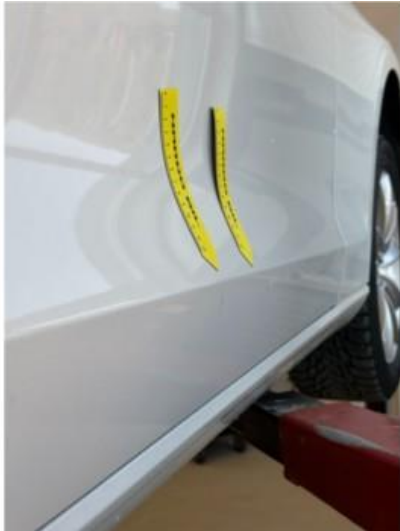
1.1 Ett par bulker i nedre del av dør høyre foran