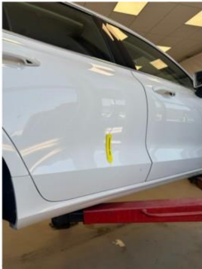
1.3 Bulk i dør høyre bak