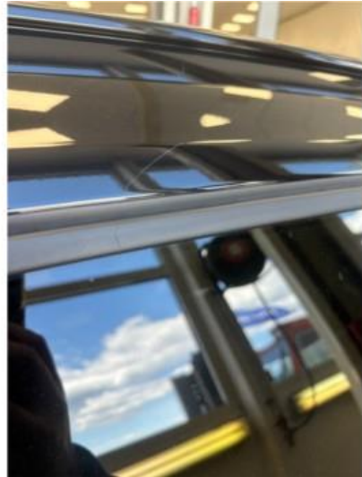
1.2 Ripe oppe på tak høyre side. Vil bli dempet med rubbing og polering