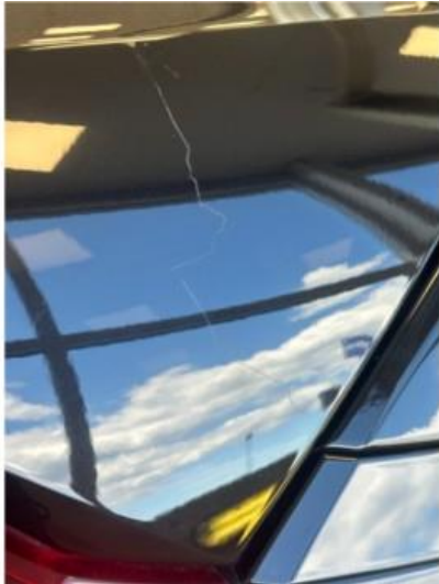
1.1 Ripe oppe på bakluke. Vil bli dempet med rubbing og polering