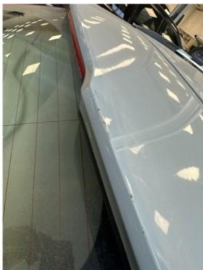
1.1 Små lakkskader opp på bakluke. Lakkeres forenklet