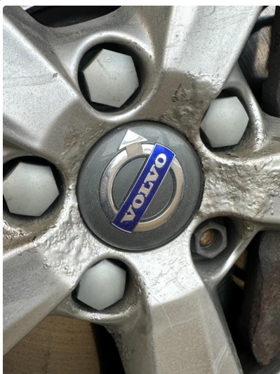
1.3 Noe oksidering i vinterfelger