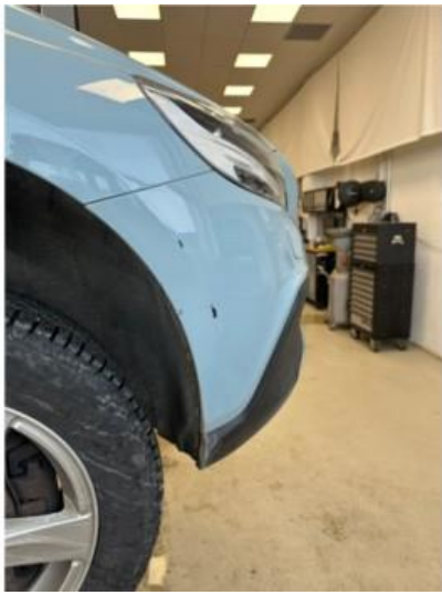
1.4 Noen lakkskader i fanger høyre foran