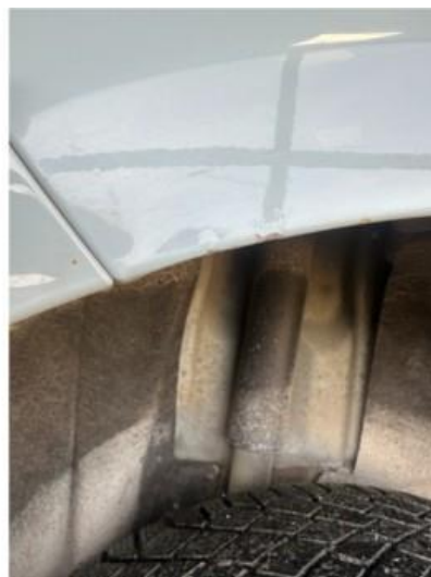
1.2 Noen steinsprut i skjerm/hjulbuer bak. Begge sider.