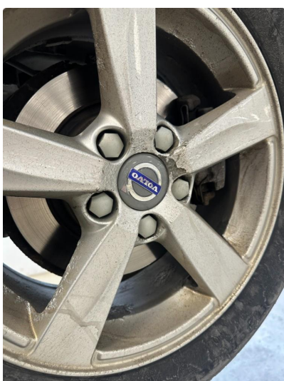
1.3 Noe oksidering i vinterfelger