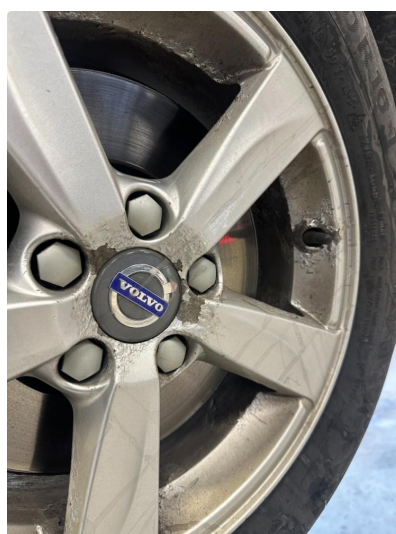
1.3 Noe oksidering i vinterfelger