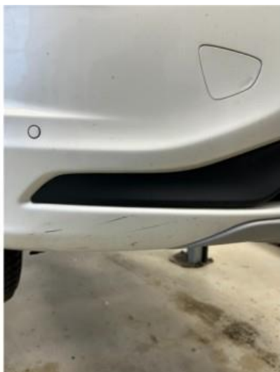
1.1 Noen riper i nedre del av fanger høyre foran