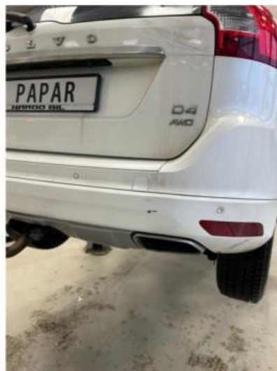
1.2 Noen hakke i fanger bak