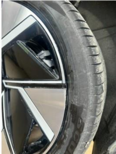
1.1 2 stk sommerfelger litt kantkjørt