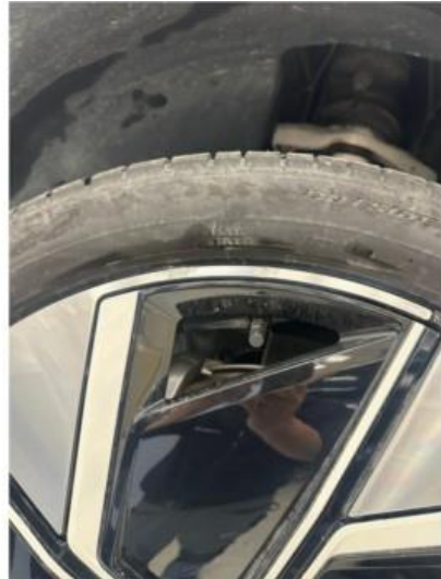
1.1 2 stk sommerfelger litt kantkjørt