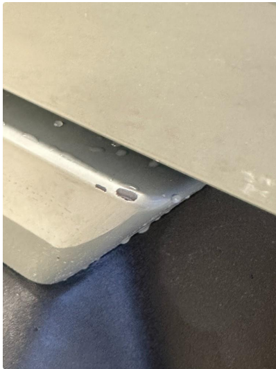
1.2 2 små hakk i fanger bak. Vil bli lakkert forenklet