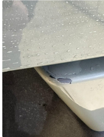
1.2 2 små hakk i fanger bak. Vil bli lakkert forenklet