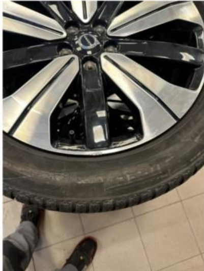
1.1 En sommerfelg litt kantkjørt