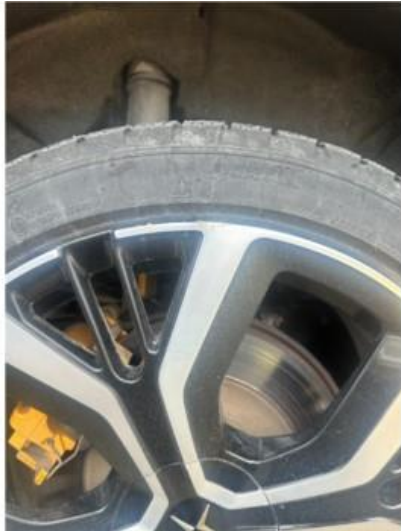
1.1 En vinterfelg litt kantkjørt