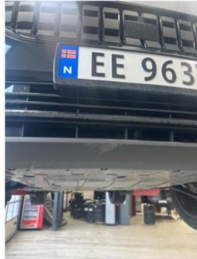
1.2 Litt oppripet på underside av fanger foran