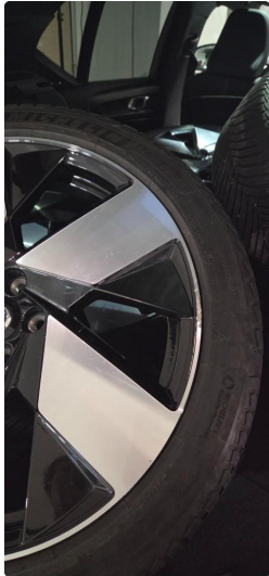
1.1 2 stk sommerfelger litt kantkjørt