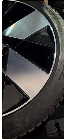
1.1 2 stk sommerfelger litt kantkjørt