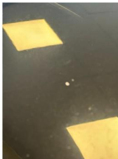
1.3 Steinsprut. A-pilar V-side + forkant av tak: flekkes