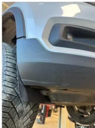
1.2 Litt oppripet på underside av fanger høyre foran