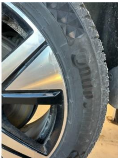
1.1 En vinterfelg litt oppripet