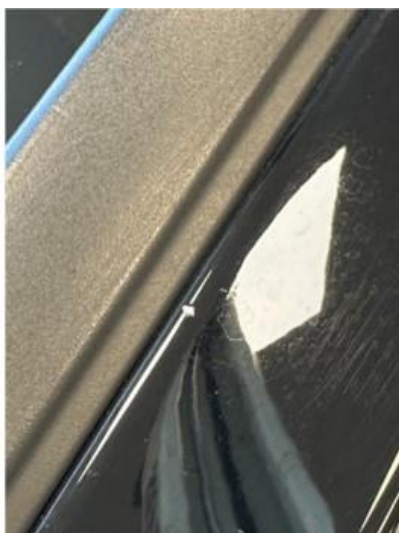
1.3 Steinsprut. A-pilar V-side + forkant av tak: flekkes