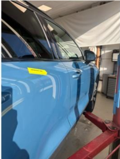
1.1 Liten p.bulk i dør høyre bak