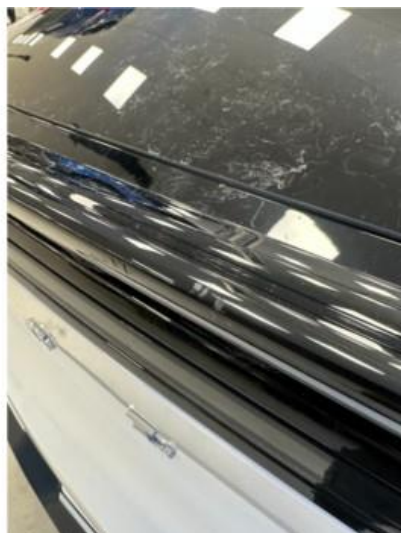
1.1 Noen riper i bakluke