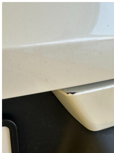
1.2 To hakk i fanger bak. Lakkeres forenklet