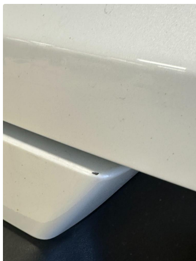
1.2 To hakk i fanger bak. Lakkeres forenklet