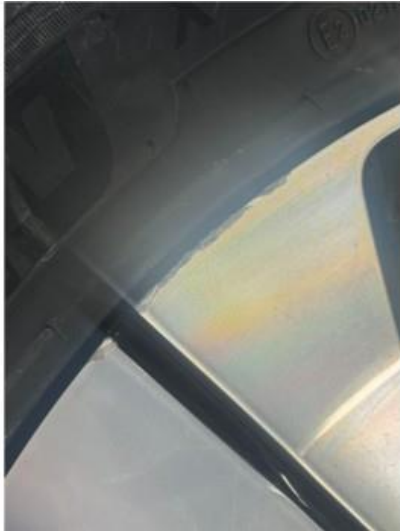
1.1 En vinterfelg litt kantkjørt