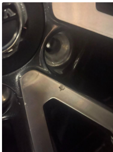
1.2 3 stk vinterfelger litt kantkjørt