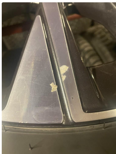
1.2 3 stk vinterfelger litt kantkjørt