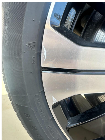
1.1 En sommerfelg litt kantkjørt