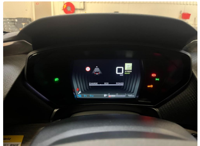
2.1 Service blir utført i starten av desember