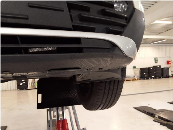
1.1 Skrubbskader underkant. Har lagt i lakk på den lakkerte listen.