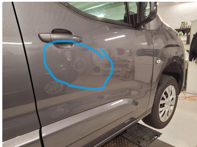
1.1 Liten park.bulk