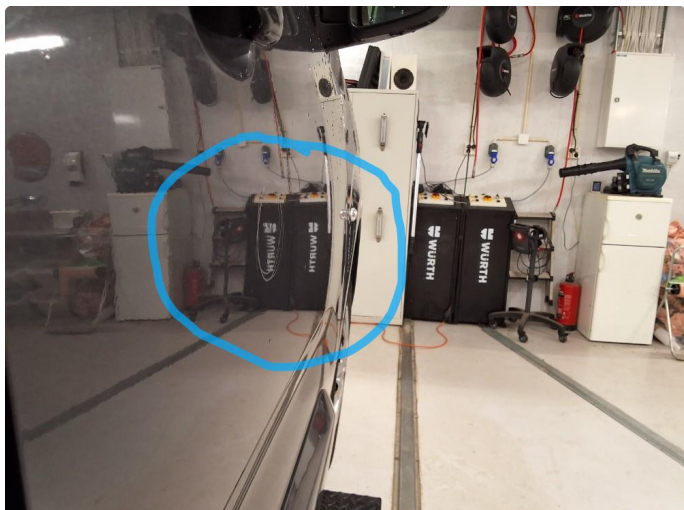
1.1 Liten park.bulk