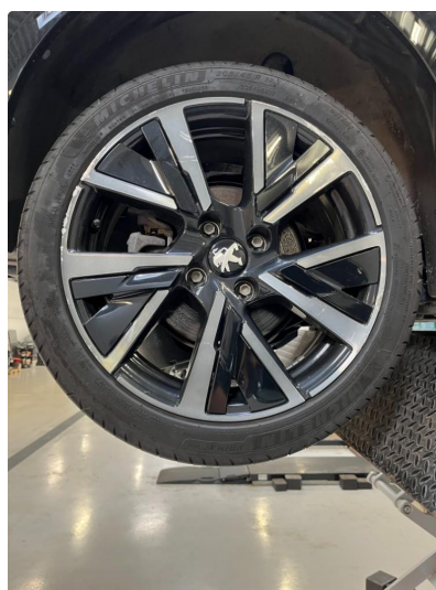
1.3 Kantkjørt felg Diamond Cut