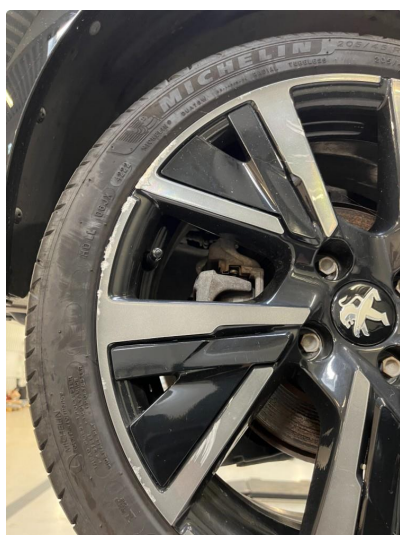
1.3 Kantkjørt felg Diamond Cut