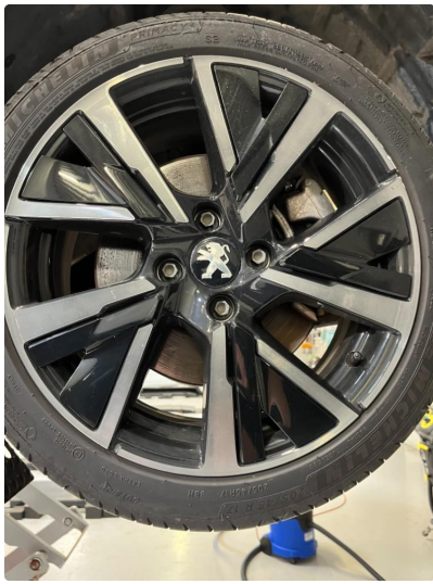
1.3 Kantkjørt felg Diamond Cut