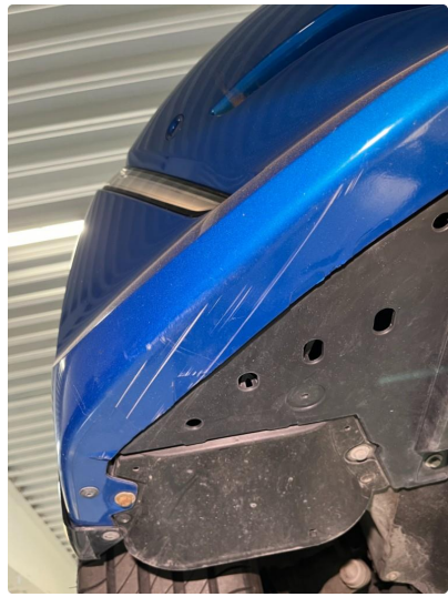
1.4 Skrubbskader underkant