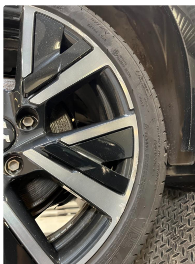
1.3 Kantkjørt felg Diamond Cut