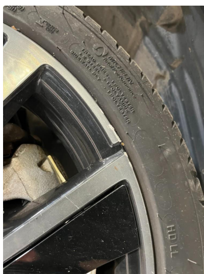
1.3 Kantkjørt felg Diamond Cut