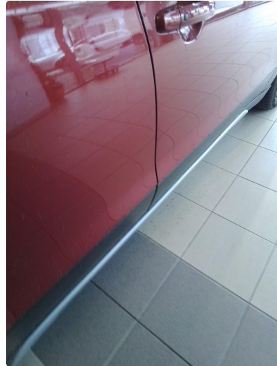
1.2 Liten park bulk