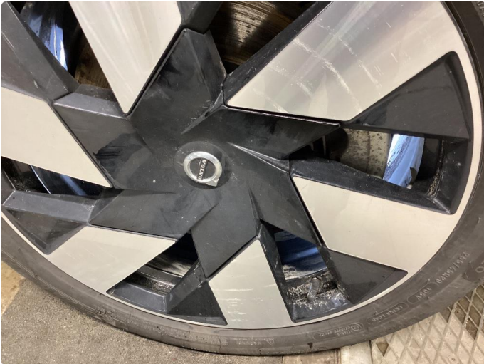
1.1 Ripe (r) gjennom lakk