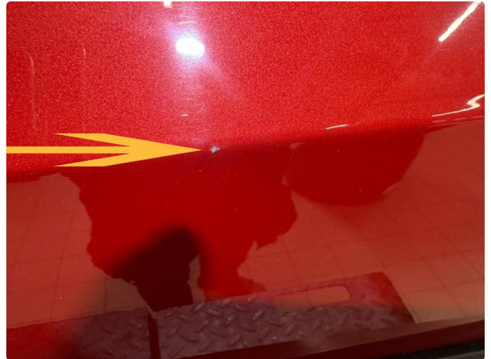
1.2 Norm ihht alder og km