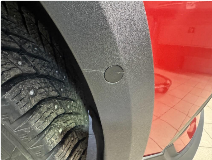
1.3 Norm ihht alder og km