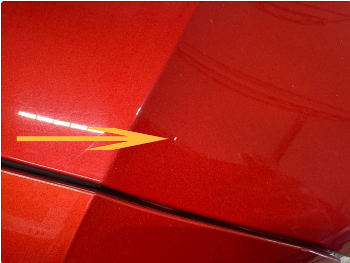
1.1 Norm ihht alder og km