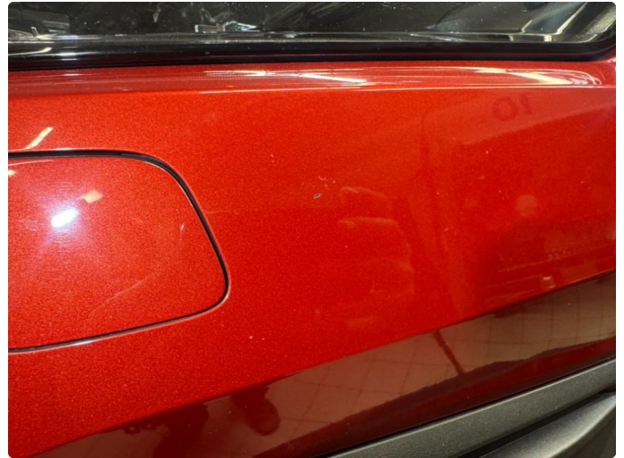
1.6 Norm ihht alder og km