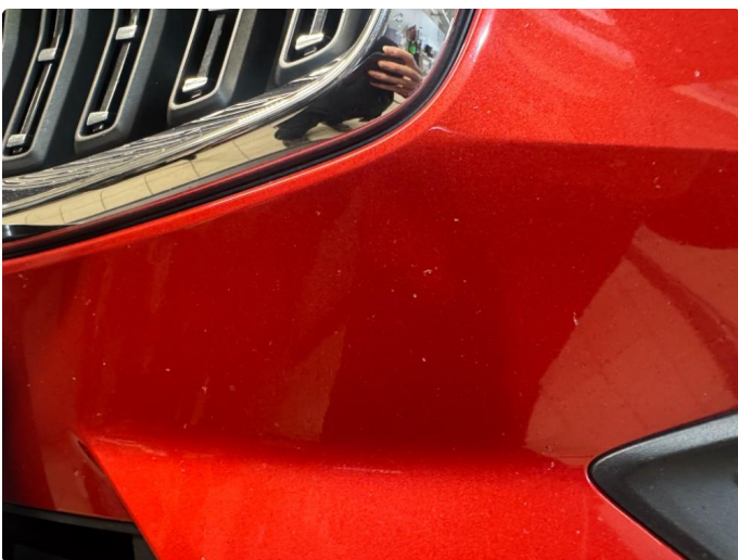
1.6 Norm ihht alder og km