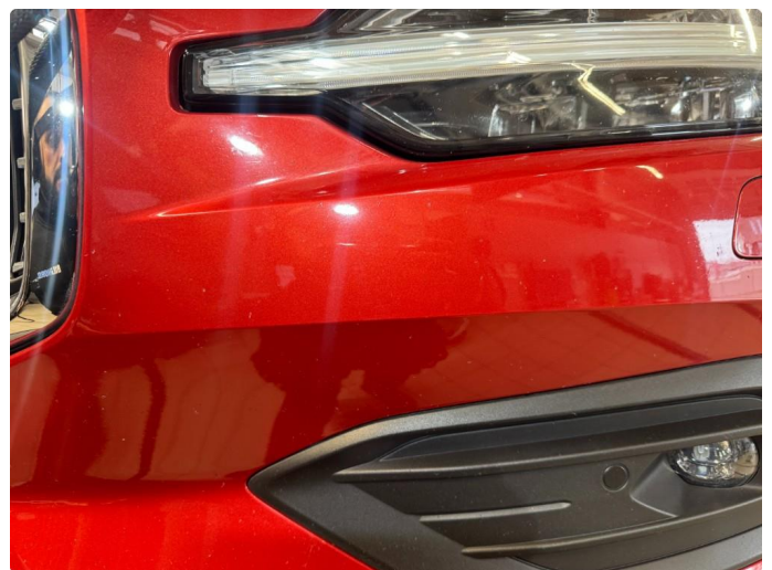
1.6 Norm ihht alder og km