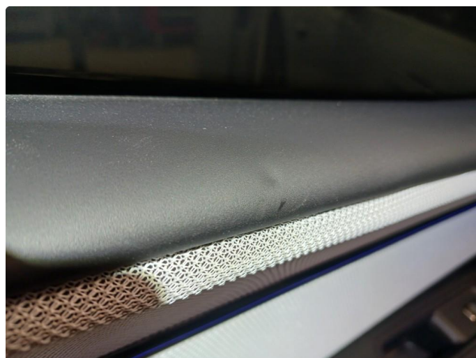
2.2 Skadet/merker etter utstyr