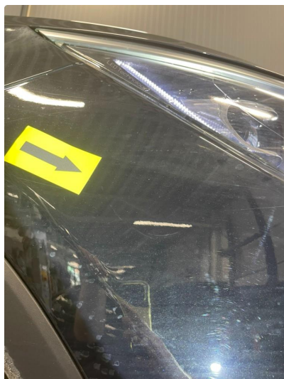
1.1 Generelt mye riper ( Poleres opp )