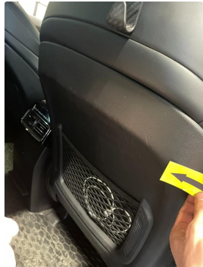
4.1 Skade på seterygg