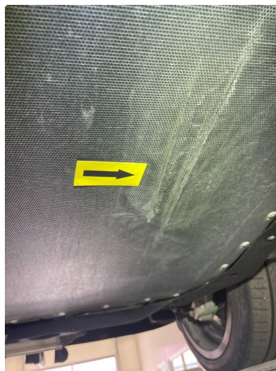
1.2 Beskyttelsesplate skadet/mangler