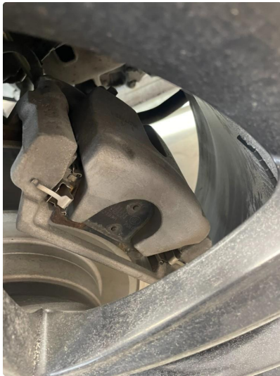
3.1 Slitte klosser ( byttes)