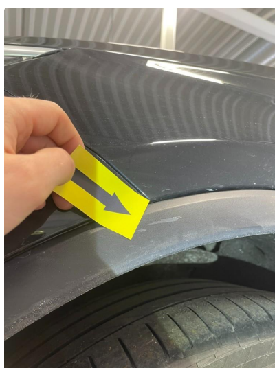
1.4 Plastinnerskjerm skadet