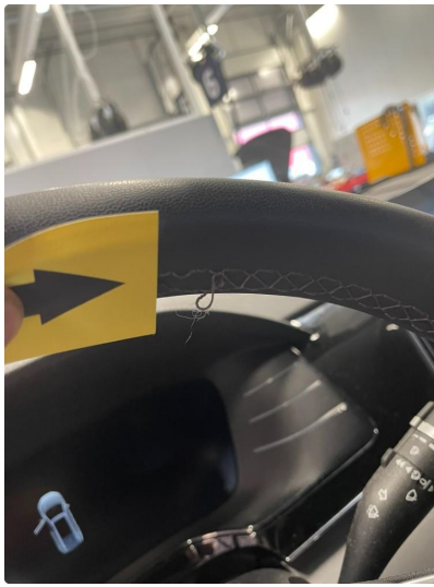
4.2 Øvrige feil ( ordnes )