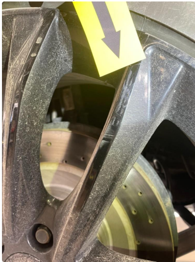
1.7 Ripe (r) gjennom lakk ( flekkes )