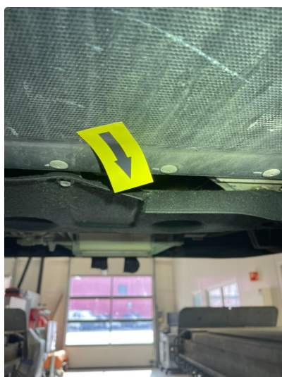
1.2 Beskyttelsesplate skadet/mangler