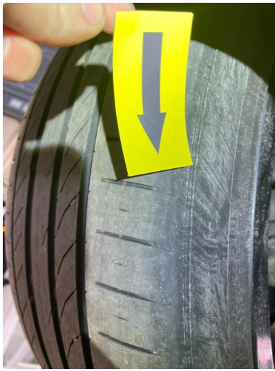
1.6 Skjev slitasje på sommerdekk ( Nye sommerdekk bestilt )