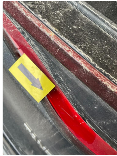
2.2 Øvrige feil