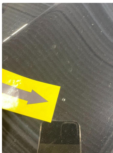
1.3 Steinsprut ( Poleres / flekkes )