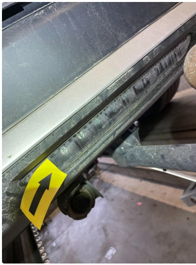
2.1 Dugg/fukt (byttes garanti )