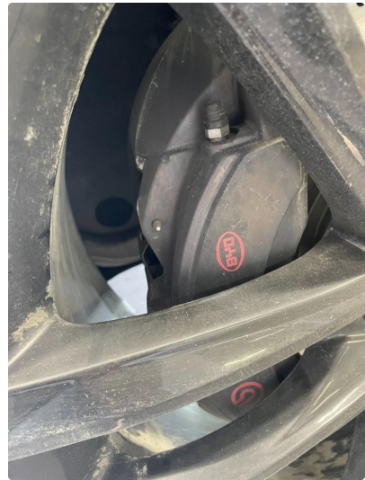
3.1 Slitte klosser ( byttes)