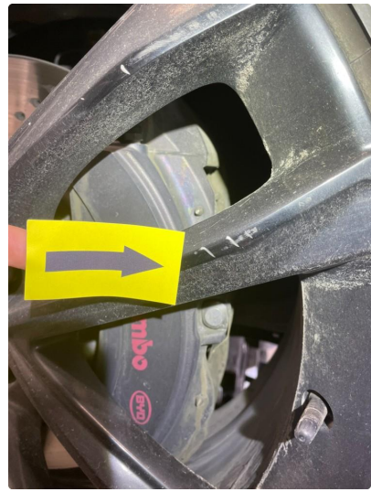
1.7 Ripe (r) gjennom lakk ( flekkes )