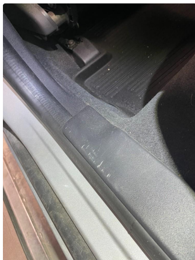
1.1 Slitt innsteg