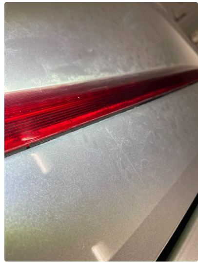
2.1 Krakelering i plast