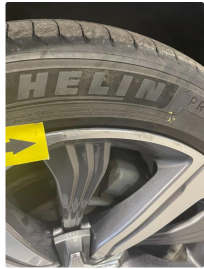
1.5 Kantkjørt felg Diamond Cut