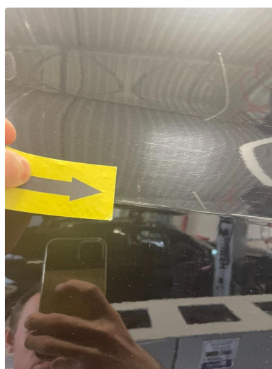
1.3 Flere p-bulker