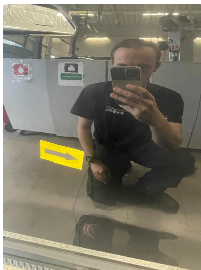
1.3 Flere p-bulker