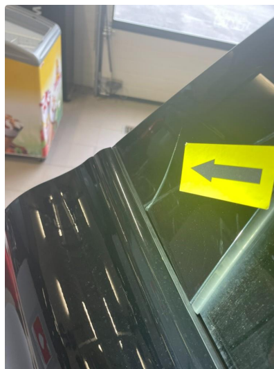
1.2 Løse/skadede lister