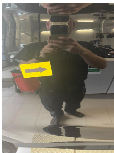
1.3 Flere p-bulker