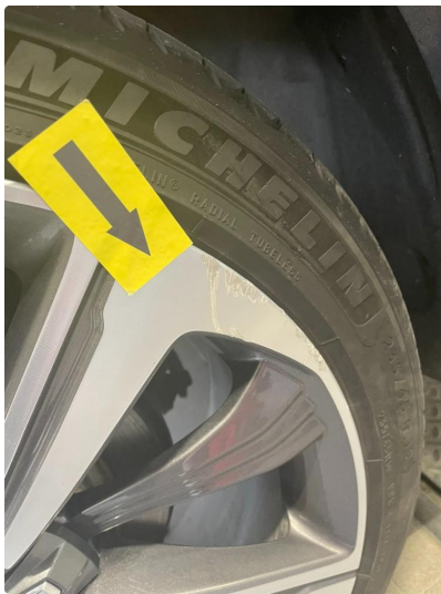
1.5 Kantkjørt felg Diamond Cut