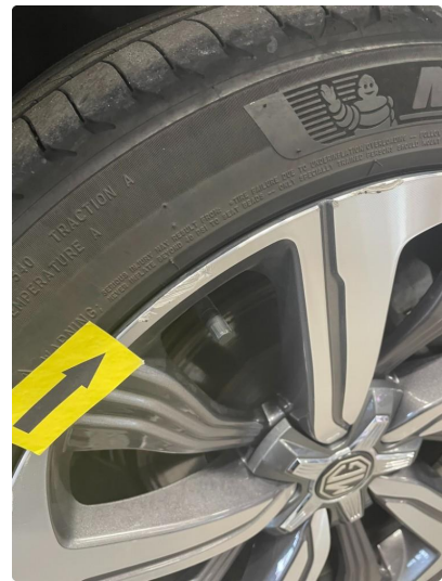
1.5 Kantkjørt felg Diamond Cut