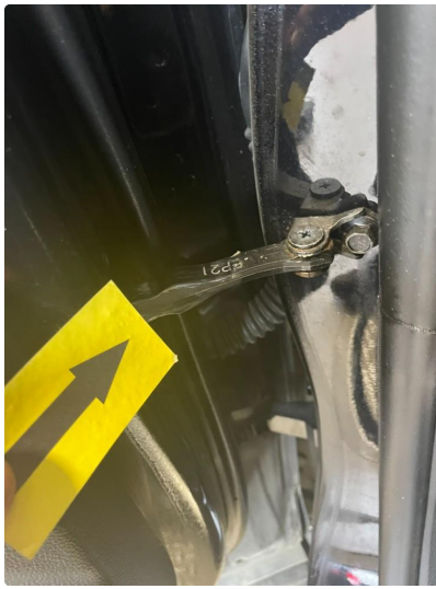
1.4 Dørstopper defekt