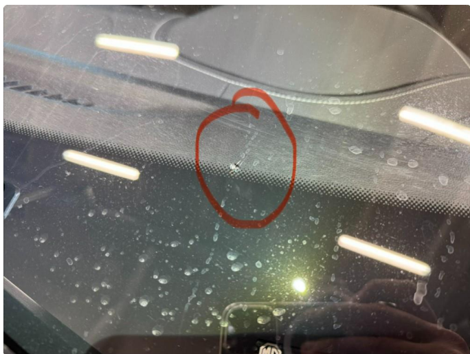
1.3 Steinsprut i synsfelt