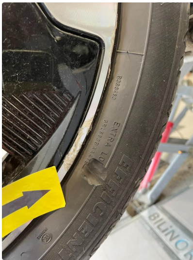
1.5 Kantkjørt felg Diamond Cut