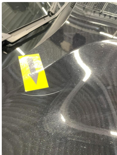
1.1 Generelt mye riper