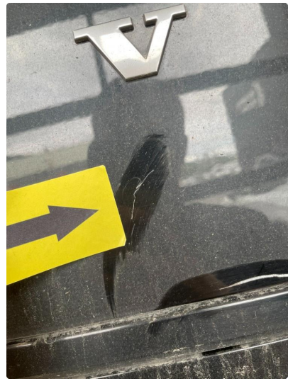
1.4 Bulk med lakkskade