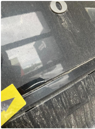
1.4 Bulk med lakkskade