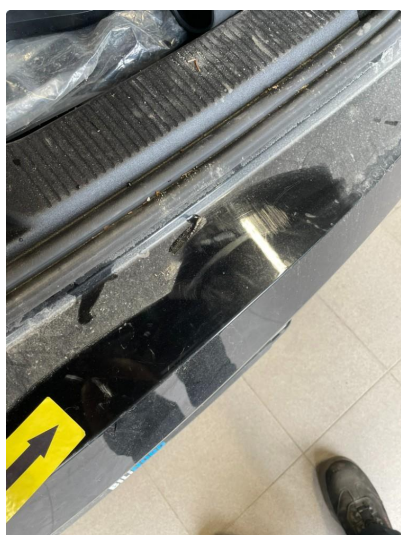
1.1 Generelt mye riper