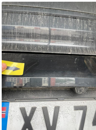
1.1 Generelt mye riper