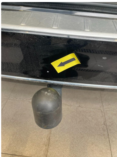
1.6 Ripe/lakk (halv del)