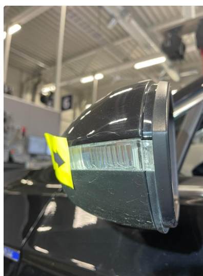
1.3 Blinklys sprukket/krakelert