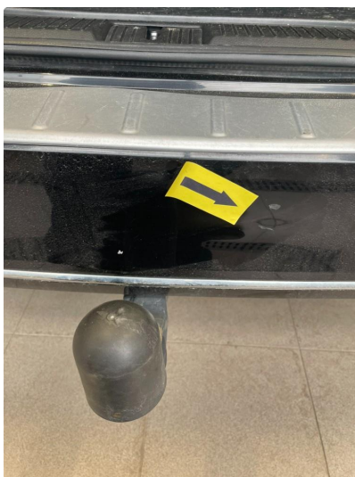
1.6 Ripe/lakk (halv del)