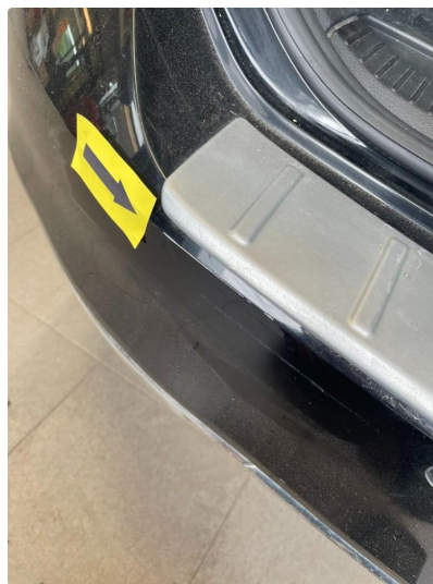
1.6 Ripe/lakk (halv del)