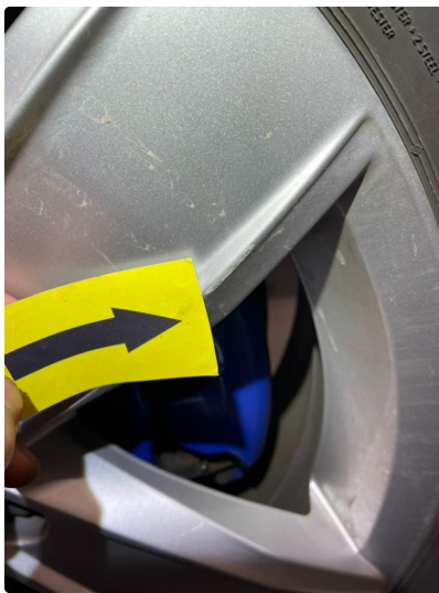
1.4 Øvrige feil