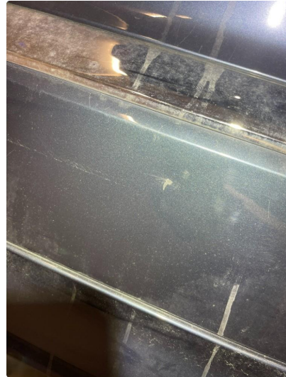
1.2 Ripe/lakk (halv del)