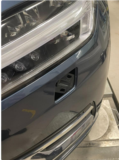
1.1 Lyktespyler deksel mangler