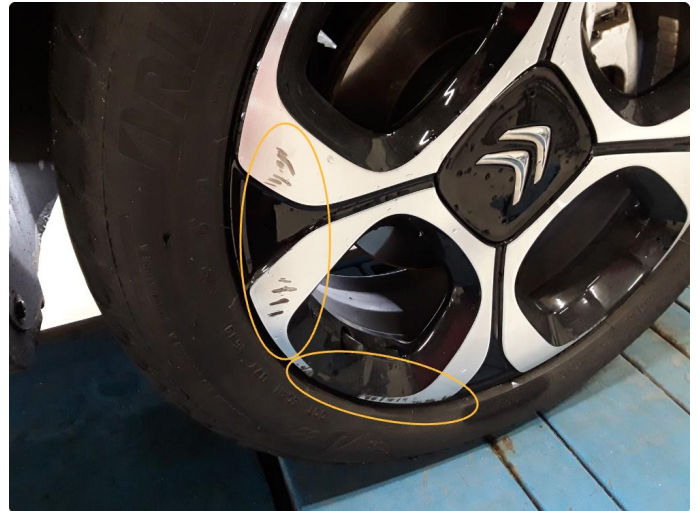
1.2 Riper felg