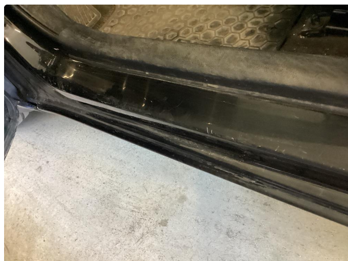
1.3 Slitt innsteg