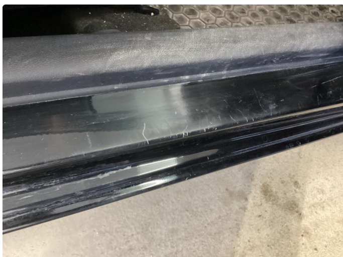
1.3 Slitt innsteg