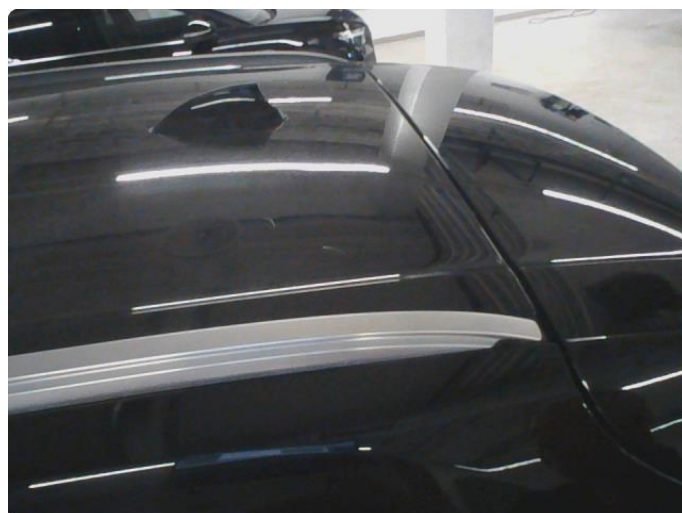
1.3 Flere bulker